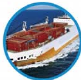
资深海运保险专才