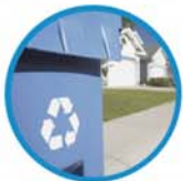
资深废物处理专家或工程师