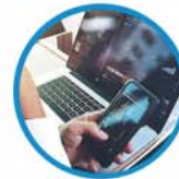
资深金融科技专才