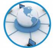
资深数据科学家及网络安全专家