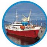
轮机工程师及船舶总管