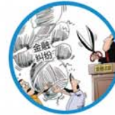
专门解决国际金融及国家与投资者之间纠纷的争议解决专才