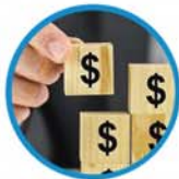
资深资产管理专才